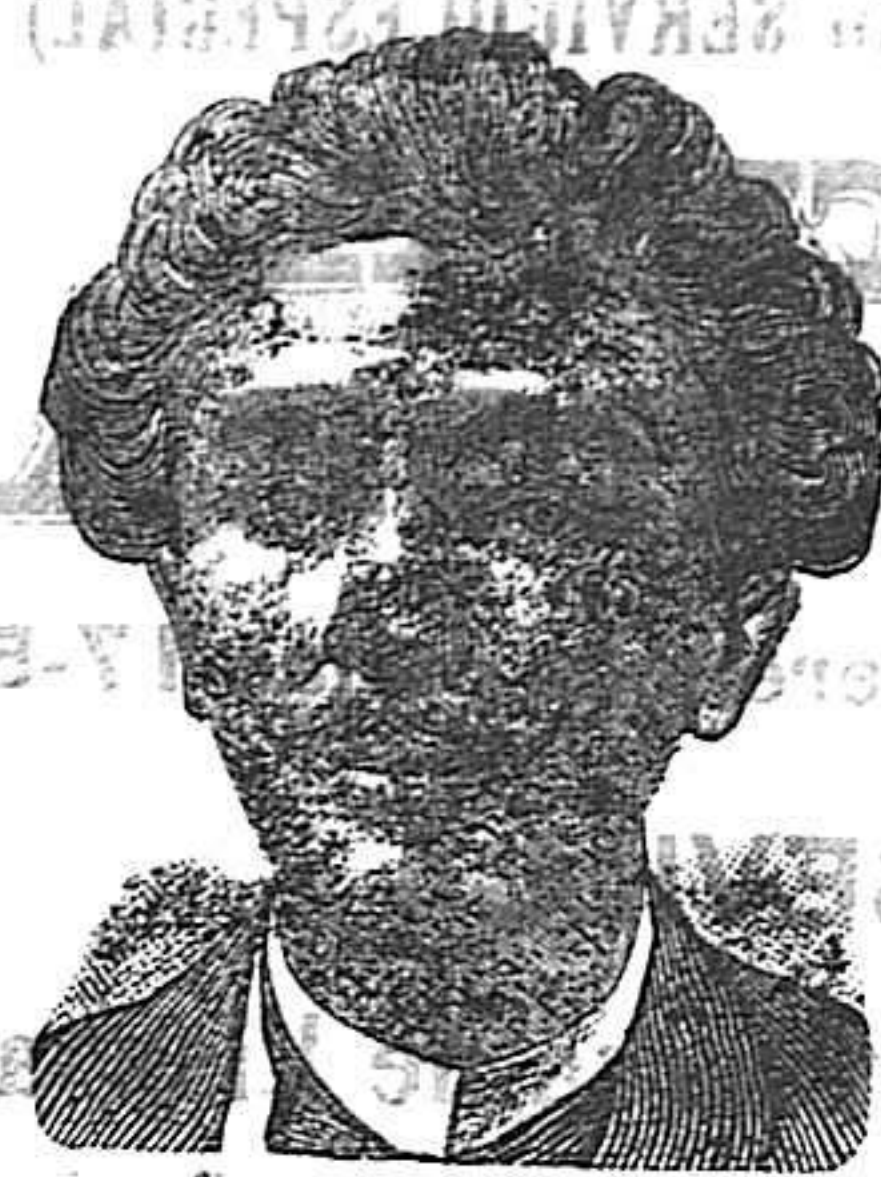
Antes de la curacion

Curación de las enfermedades de la piel y también de las llagas y de las piernas LA PIEL MALES DE LAS PIERNAS