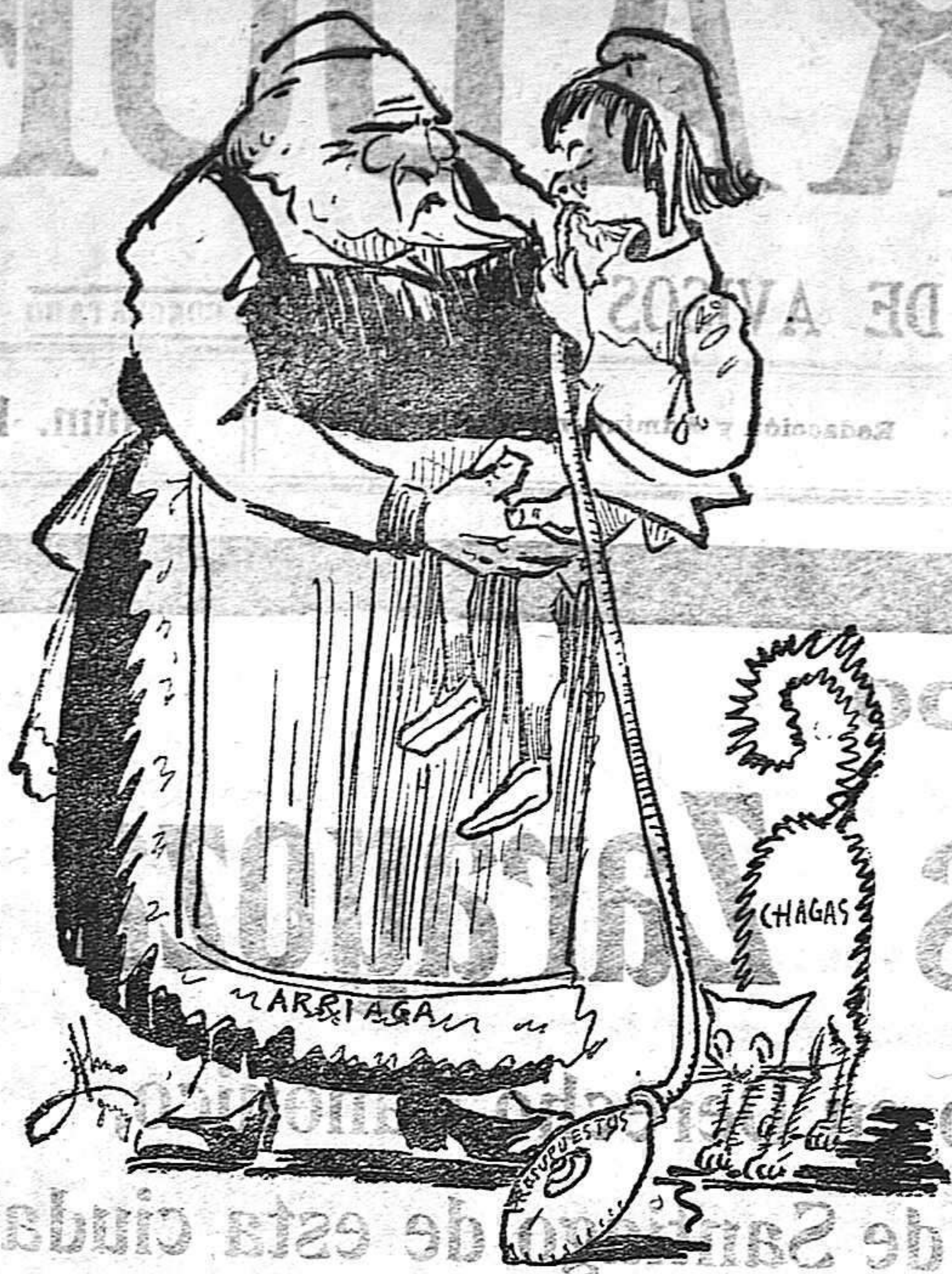
Ariaga.—Pero... no llores, hija. ¿Aun te parece poco ese biberón? La pequeña.—Es que me ha asustado el gato.

imágenes diferentes es relativamente fácil. Ahora se ha reducido en el cinematógrafo la trimeromía a dicromía. En Inglaterra se exhiben vistas cinematográficas con los colores bastante fieles proyectando dos cintas uniformemente coloradas, la una en rojo violáceo, y la otra en amarillo verdoso.