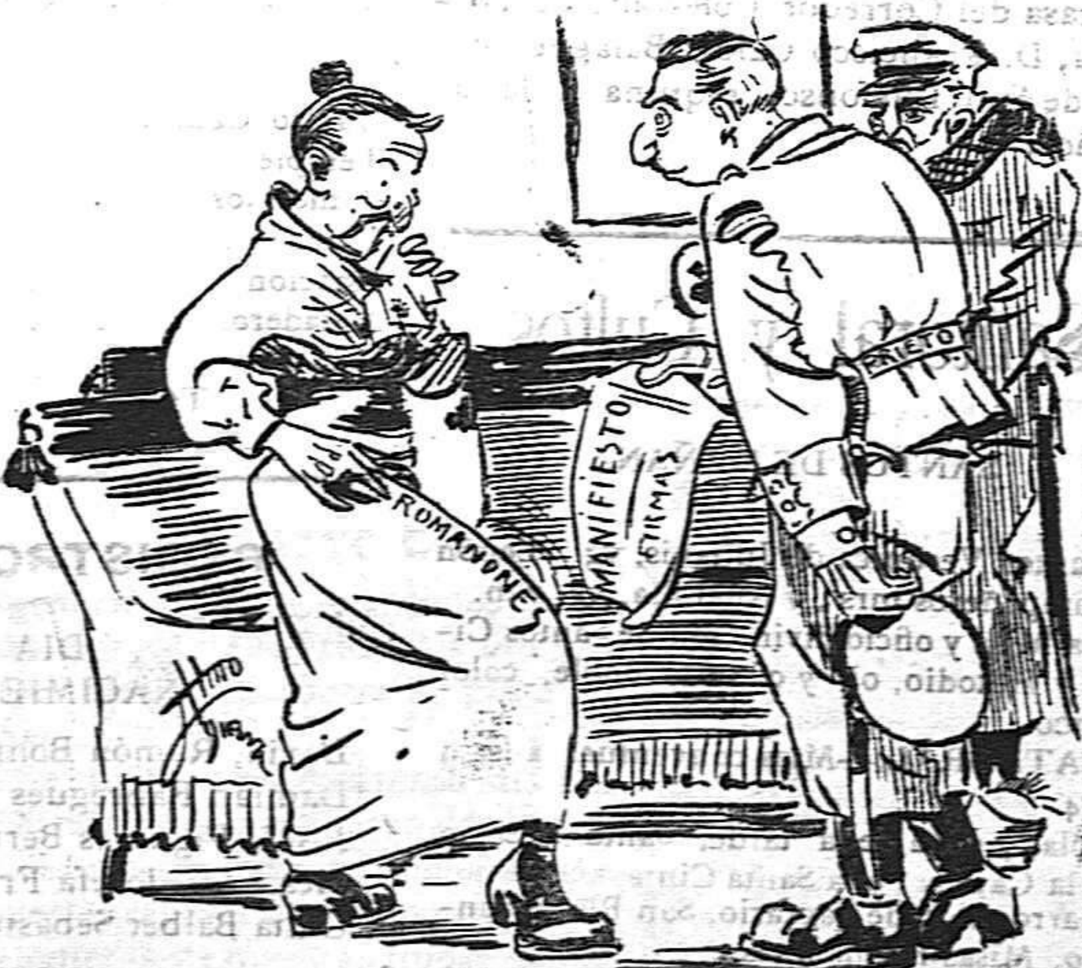
El guardia.—¿La señora Figueroa? ¡Tome y rásques!