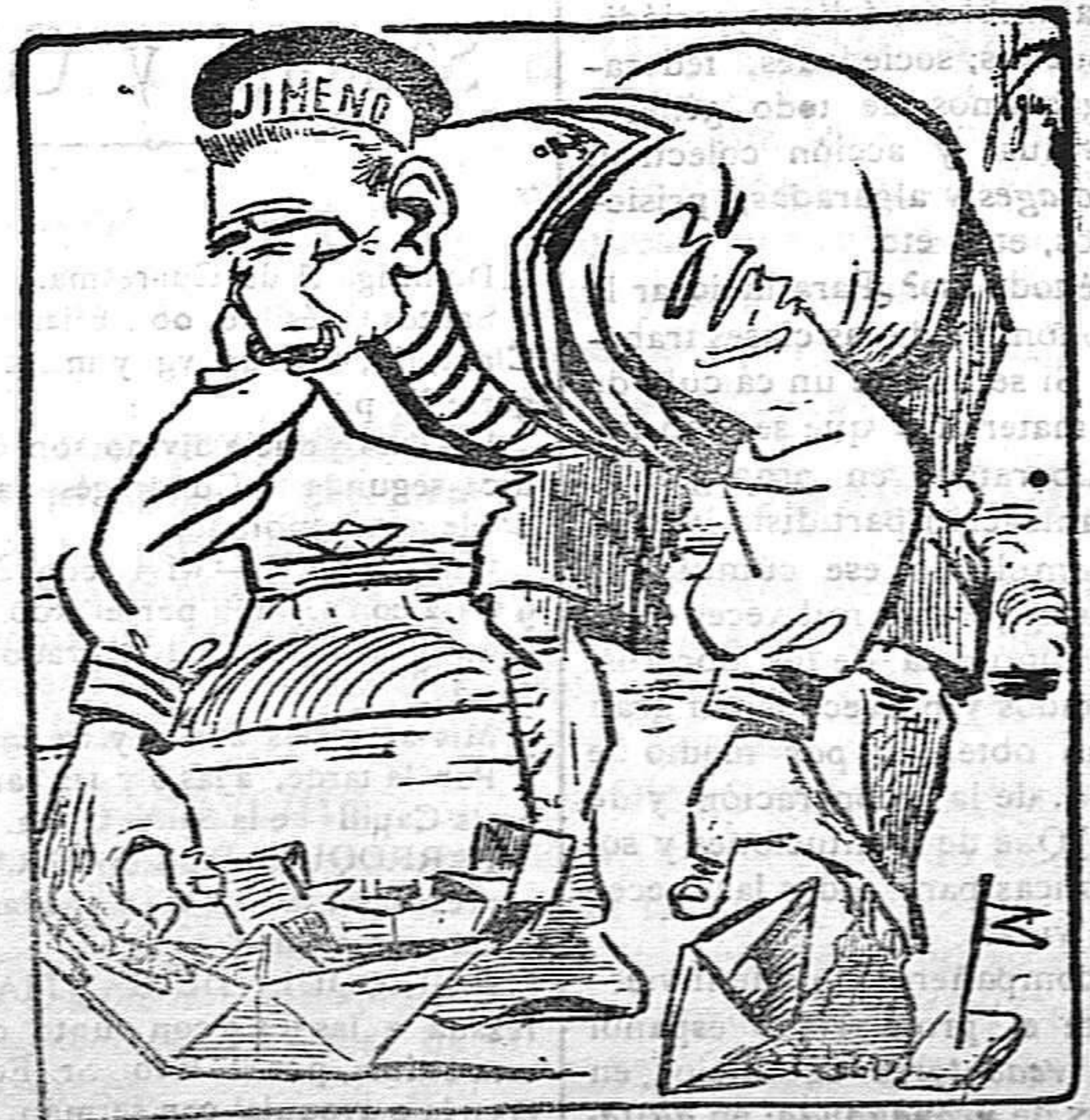
¡Buena! ¿Y qué hago yo con estos barquichuelos?