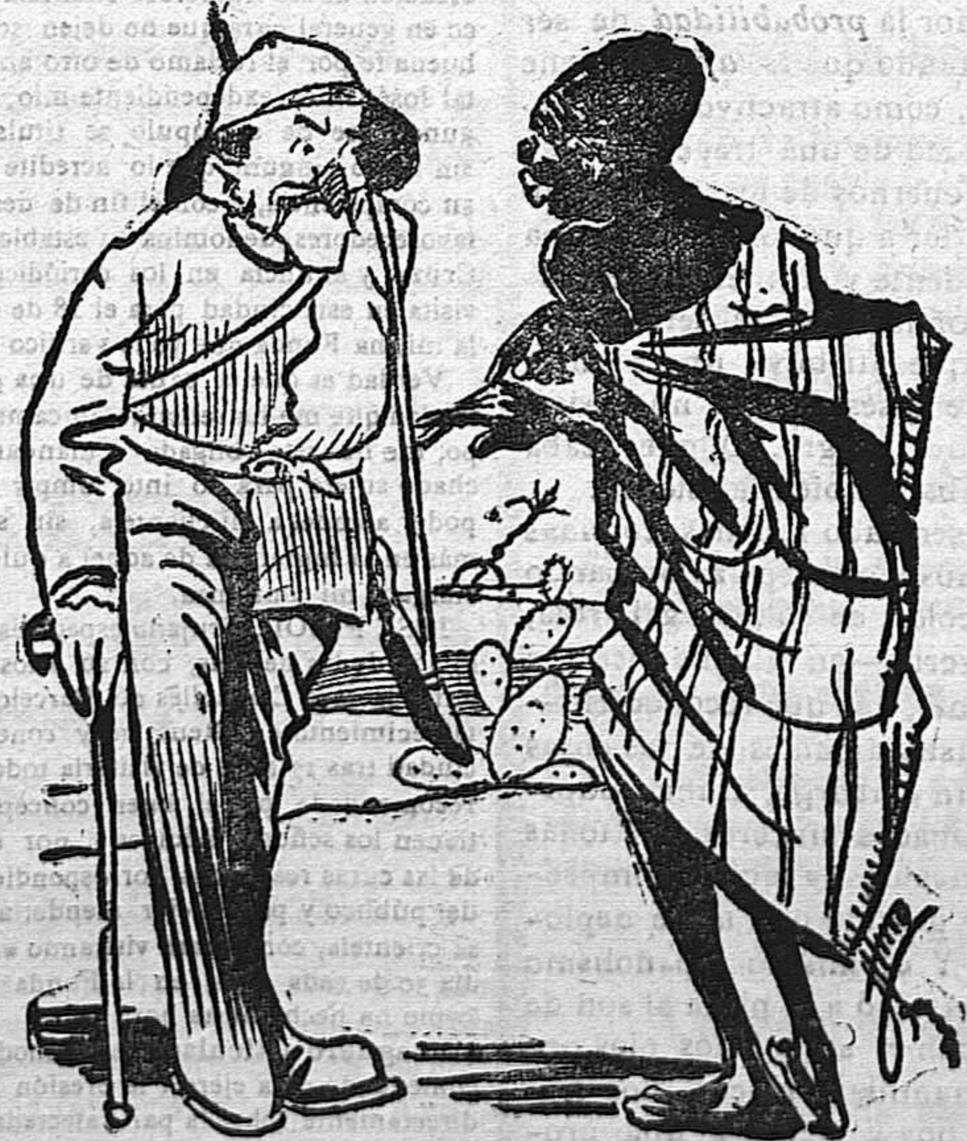
El morito.—¿Osté venir de caza? Romanones.—De pesca.