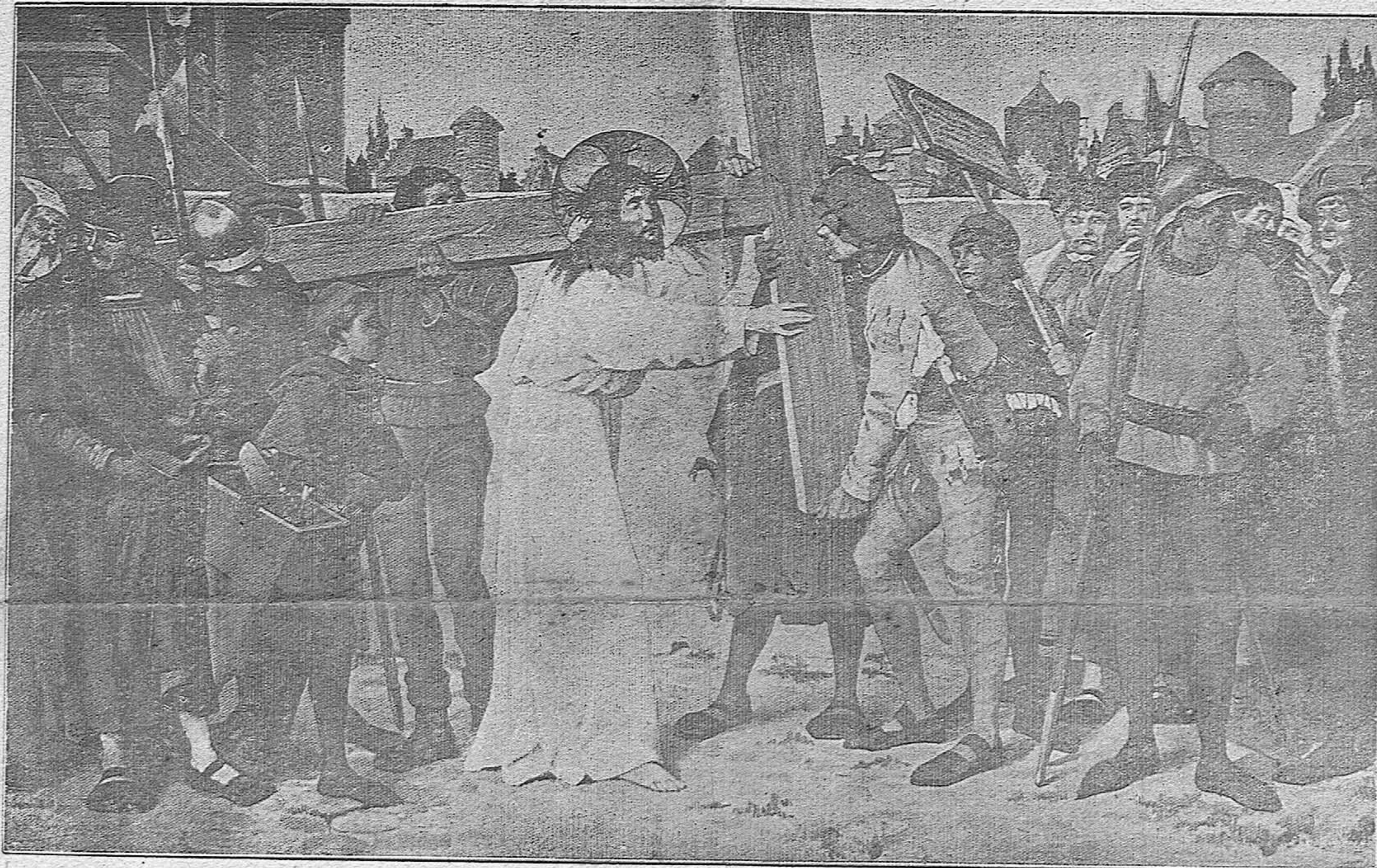
CAMINO DE LA CRUZ (cuadro de Lybaert)