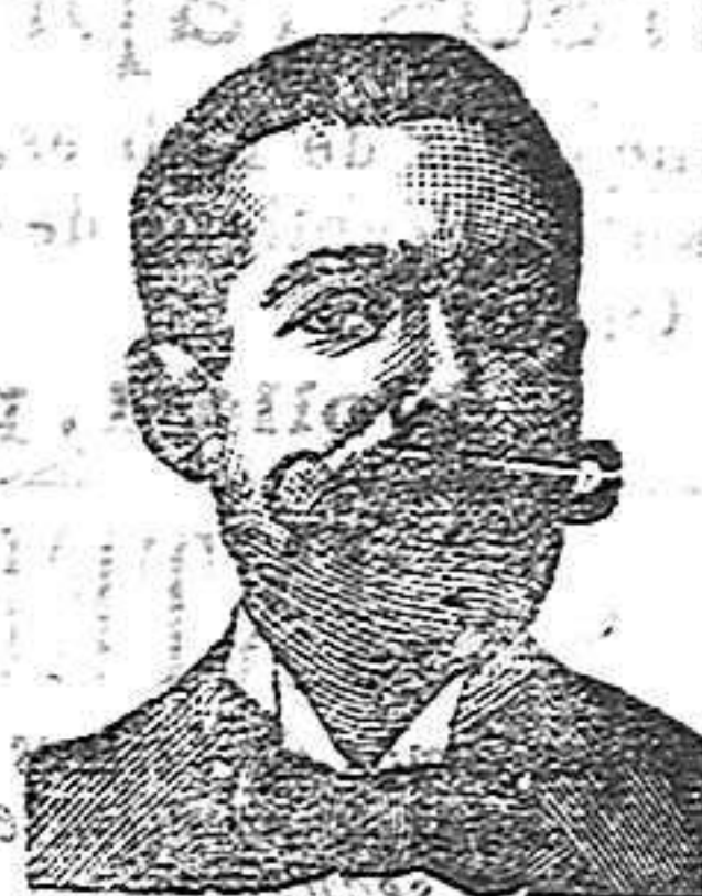
A. SALVATI COSTANZI

Para orientarse se envia gratis y franco el prospecto oficial á quien lo pida