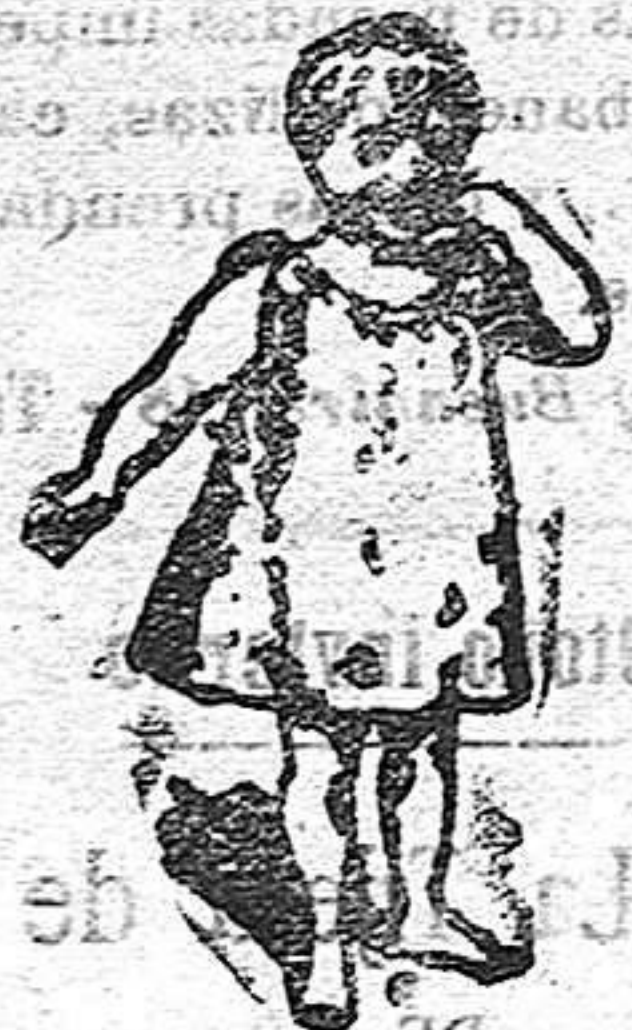
Así se registra