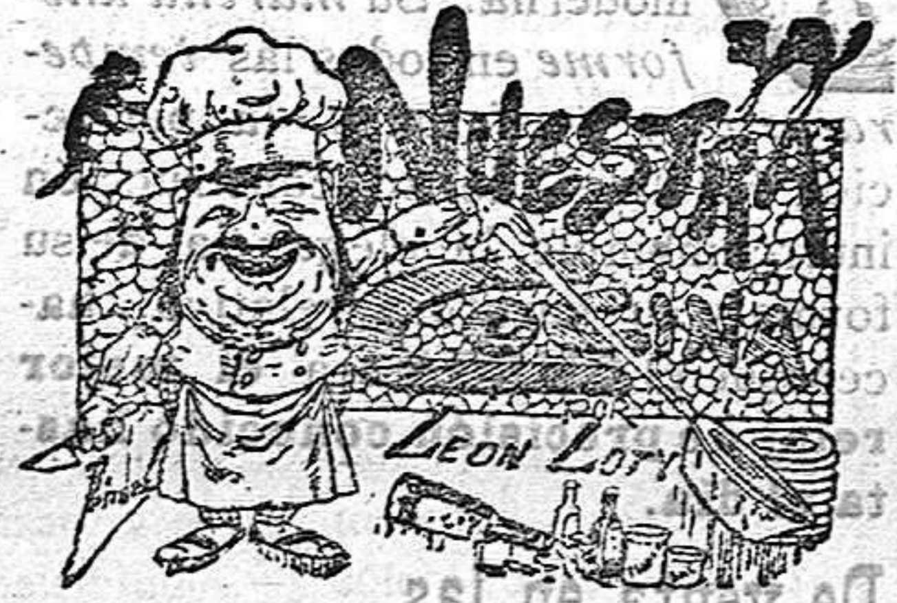
COMIDAS PARA EL 30 DE ENERO POR LEON LOTY

Se abre un nuevo curso de Cálculos mercantiles y de Teneduría de Libros.