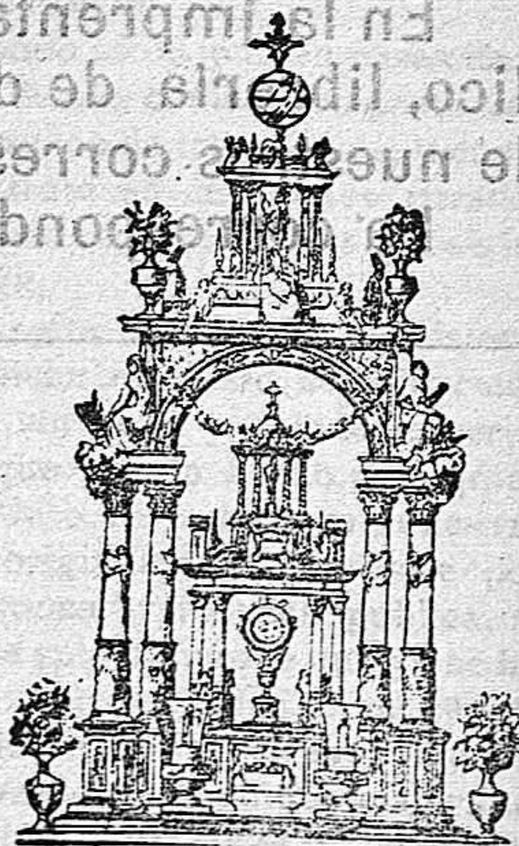
La custodia del Santísimo Sacramento en Madrid

Es esta una alhaja magnífica que se exhibe únicamente en la proce-