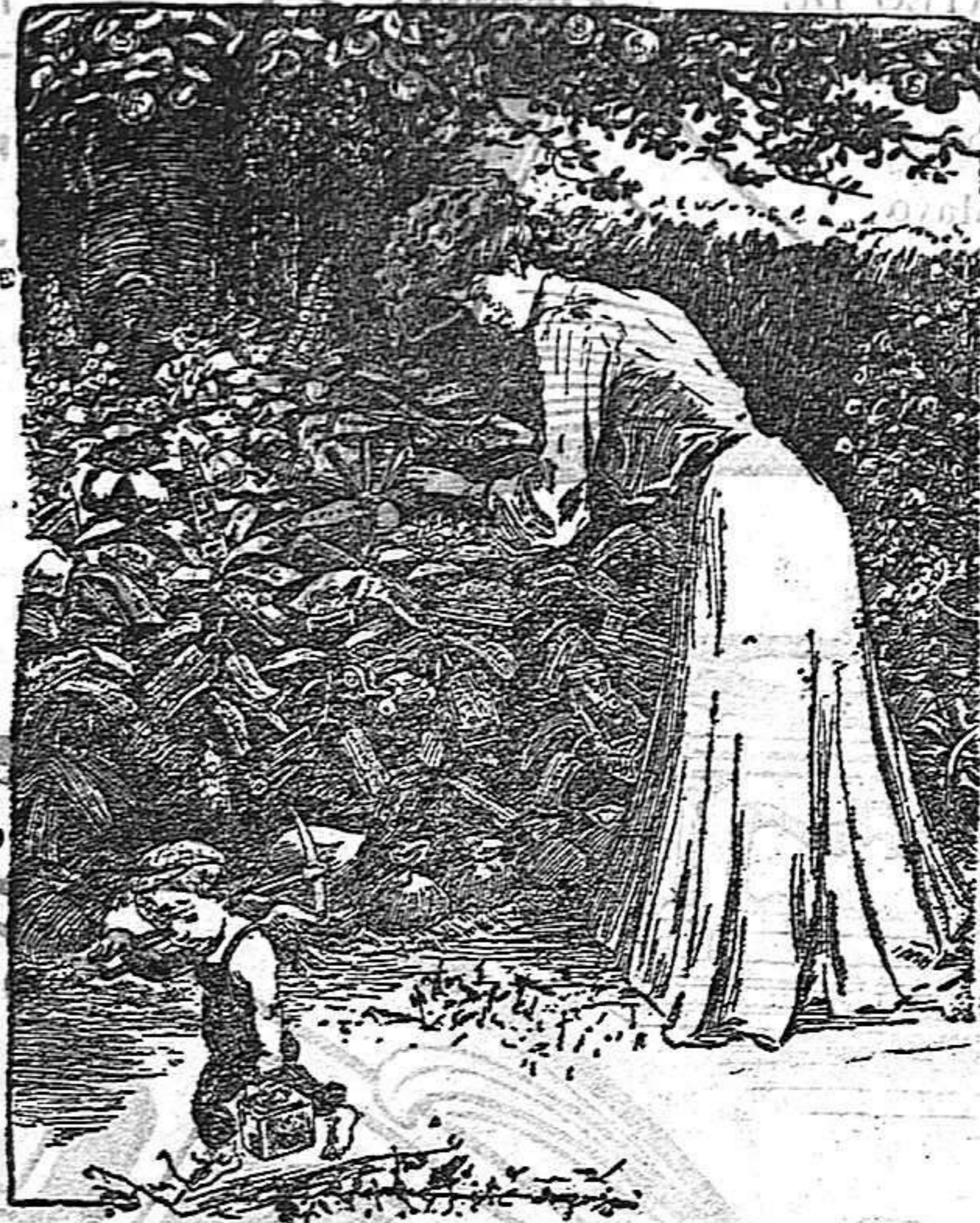
En busca del amor. ¿Donde estará?