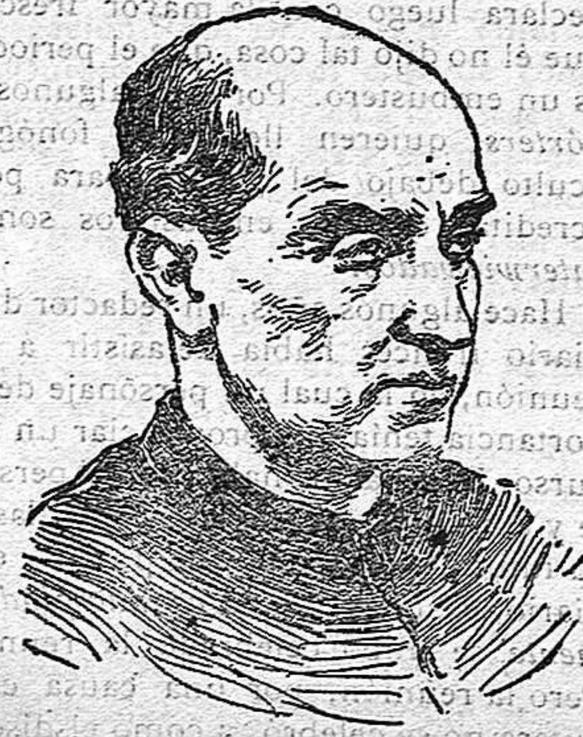
EL RDO. PADRE COLOMA, S. J.

La recepción tuvo la brillantez acostumbrada en todos los actos de esa naturaleza, y el discurso del recipiendario produjo en el escogido auditorio la complacencia y la grata emoción que causa en nosotros todo lo bello y sugestivo. Con acierto digno de los talentos que en él se reconocen, el nuevo académico eligió para tema de su discurso la obra literaria é histórica de otro ilustre padre de la Iglesia: el padre Isla, de quien ha hecho un bien documentado é interesante estudio crítico-biográfico, poniendo de relieve su valer como hombre de letras. Para ponderar el trabajo