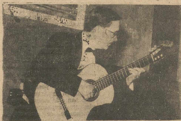
El ilustre concertista de guitarra Manuel Díaz Cano, durante su magnífico concierto de ayer en la Diputación Provincial, que constituyó un rotundo éxito.

La presentación del famoso concertista de guitarra constituyó un auténtico acontecimiento musical