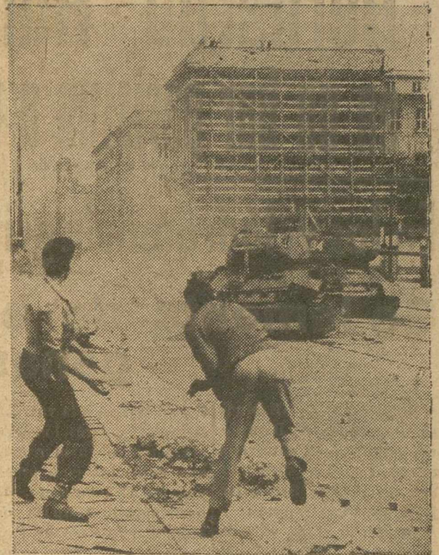
Dos habitantes del Berlín oriental, en la Plaza de Lelpzig, apedrean unos tanques soviéticos durante el primer día del levantamiento contra el dominio ruso. Aunque la foto nos llega con retraso, ahí queda la otramuera de la rebelión alemana contra la opresión comunista.

Venta de localidades en Albacete: Pablo Medina, 7