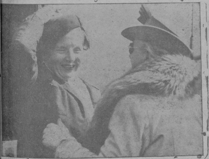
La Reina Guillermina de Holanda saluda a la Princesa Juliana en un aeropuerto inglés a su llegada desde el Canadá