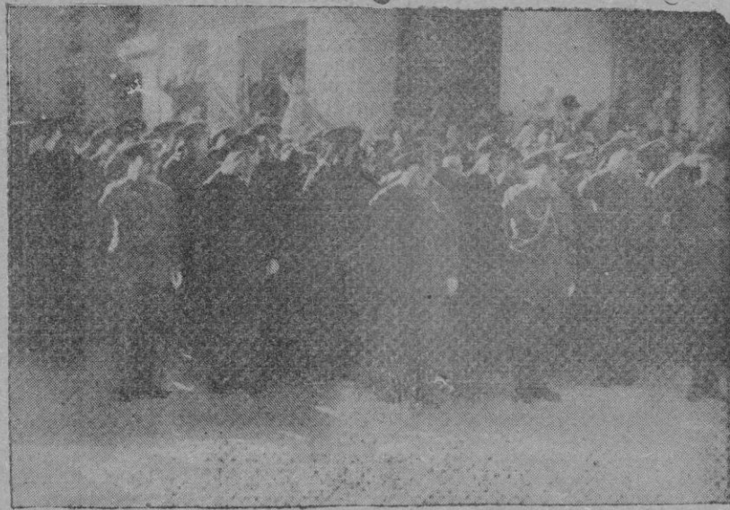
De la fiesta de la Patrona de la Artillería. — Las Autoridades presenciando el desfile, en el momento de pasar las banderas

Hoy miércoles día 8 festividad de la Purísima a las 2'45 de la tarde en el campo del C. D. Soledad contendrán en partido de campeonato de primera categoría los equipos arriba citados. Dicho partido ha despertado gran interés debido a que dichos equipos presentarán nuevos jugadores que han ido a reforzar sus cuadros.