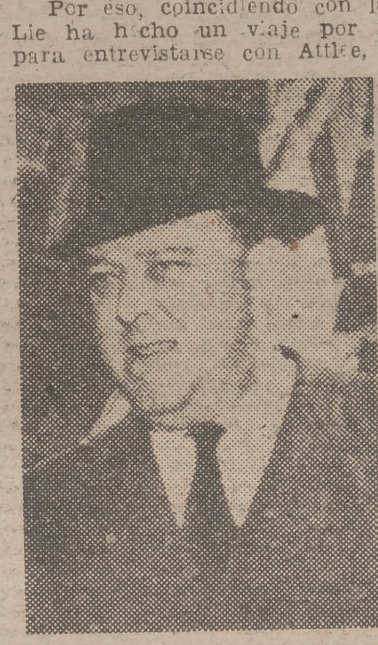
TRYGVE LIE Un optimista

Ahora ha surgido Trygv. Lie con su fórmula y sus puntos correspondientes. El secretario de la O. N. U. teme por la suerte de ésta y con fundados motivos, hay que convenir.