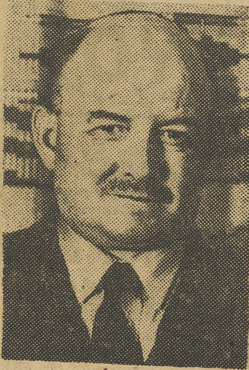
Primera fotografía del dirigente polaco Mikolajczyk a su llegada a Londres en la mañana del 3 de noviembre.