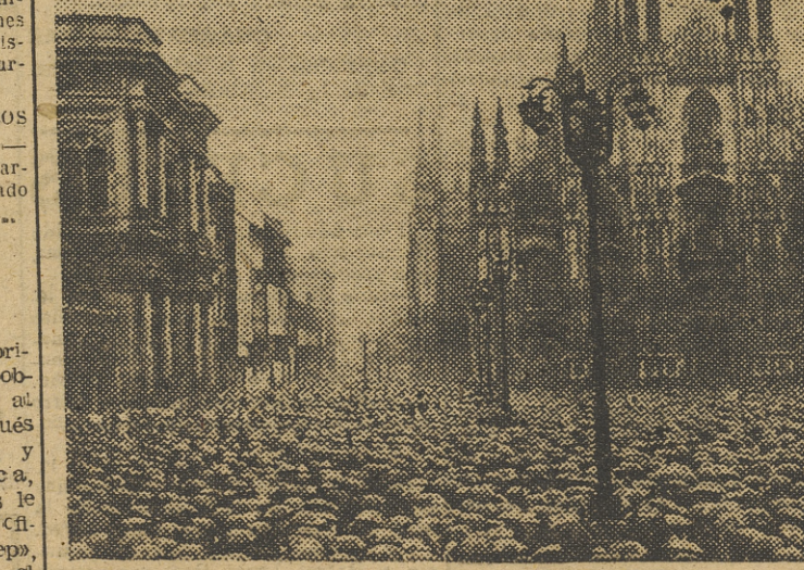
Con una manifestación monstruo, en la que, pese a la fortísima lluvia, participaron muchos millares de personas, los obreros de Milán han demostrado su protesta contra el anuncio de la Confederación de Industrialistas de despedir a muchos productores, debido a la actual crisis italiana en el terreno económico.