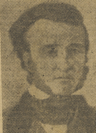
EDGAR ALLAN POE

Con exquisita sensibilidad para las exigencias de la moda literaria, la nueva colección «El carro de estrellas» inaugura sus publicaciones con un libro de Poe: «Cuentos de lo grotesco y lo arábescos». Se trata de un volumen editado con sencilla pulcritud, en el que los cuentos del famoso poeta aparecen traducidos por R. Lasso de la Vega y prologados por la excelente pluma de Juan Bautista Torrelló Barenys. El contraste que hace la literatura verdaderamente horripilante de Poe, con las truculencias del «tremendismo» de actualidad, es la mejor crítica que puede hacerse del género. El elemento morboso de estos cuentos no es burda escenografía, ni siquiera consumada luminotecnia, sino el ambiente psicológico de unas sensibilidades enfermas, captado en su sombrío rigor por un gran artista doliente o inadaptado. Sin