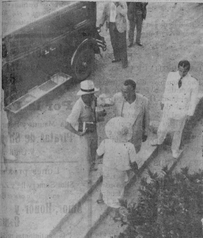
De la estancia del Príncipe de Gales en Mallorca. — El príncipe a la llegada al Hotel Formentor

Participa a sus clientes que hasta mediados de Septiembre solo visitará en Palma los miércoles y sábados.