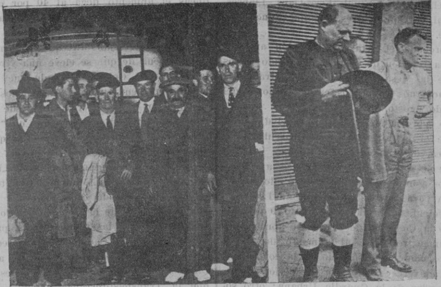
Dos grupos de asistentes a la asamblea de agricultores catalanes