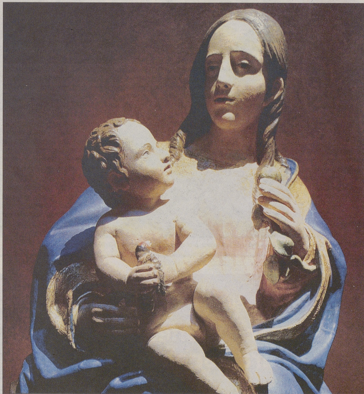
Virgen con niño, atribuida a Vasco de la Zarza, procedente de la parroquia de Cardeñosa.

Este templo dedicado a San Miguel Arcángel, aunque no muy grande, figura entre los más completos del siglo XV, antes de tomarse por modelo el de Santo Tomás de Ávila. El retablo principal es semejante al del Barraco pero mucho menor y con pulseras laterales. En el banco aparecen los Evangelistas y los profetas recostados. Existen columnas redondas y cuadradas llenas de adornos, frisos con niños cabalgando y entrecalles con estatuillas, todo de la escuela de Berruguete.