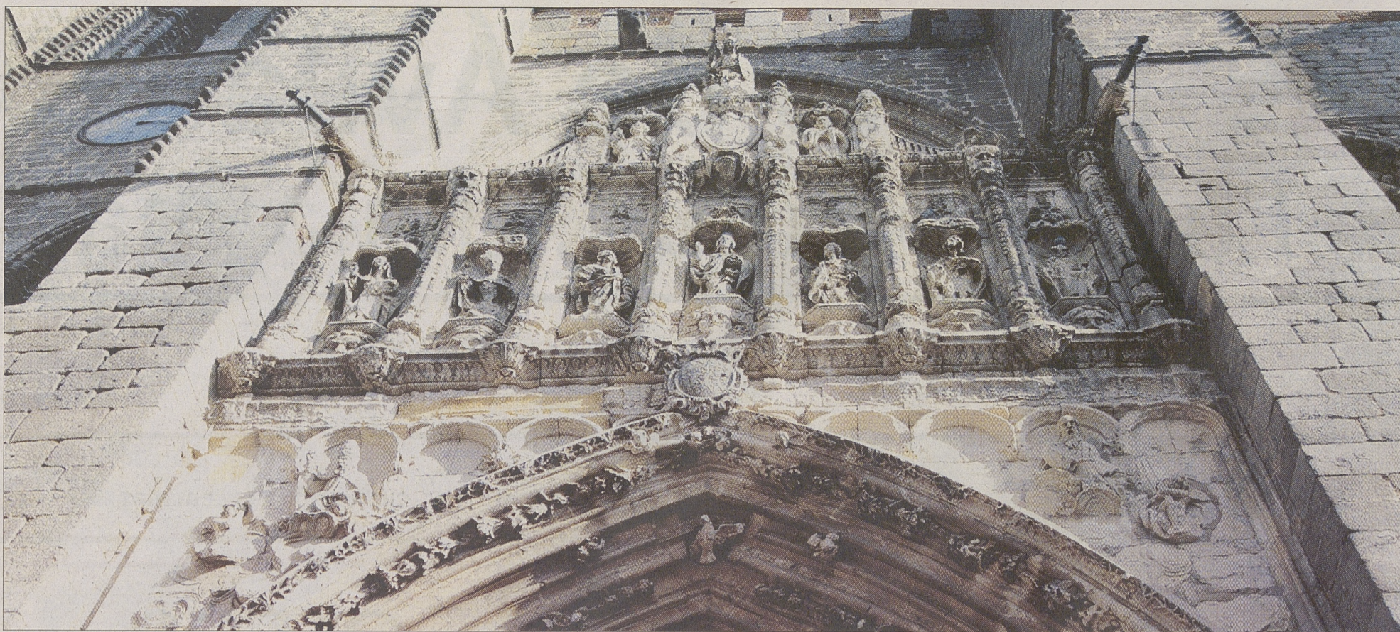
Detalle de la fachada oeste de la Catedral del Salvador, sede de 'Testigos'.