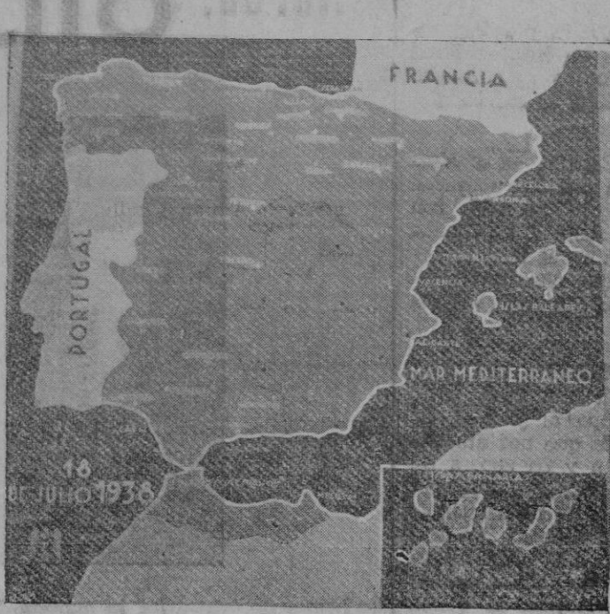
TRES INTERESANTES GRAFICOS QUE DEMUESTRAN LA IMPORTANCIA DE LAS VICTORIAS OBTENIDAS POR EL EJERCITO NACIONAL.