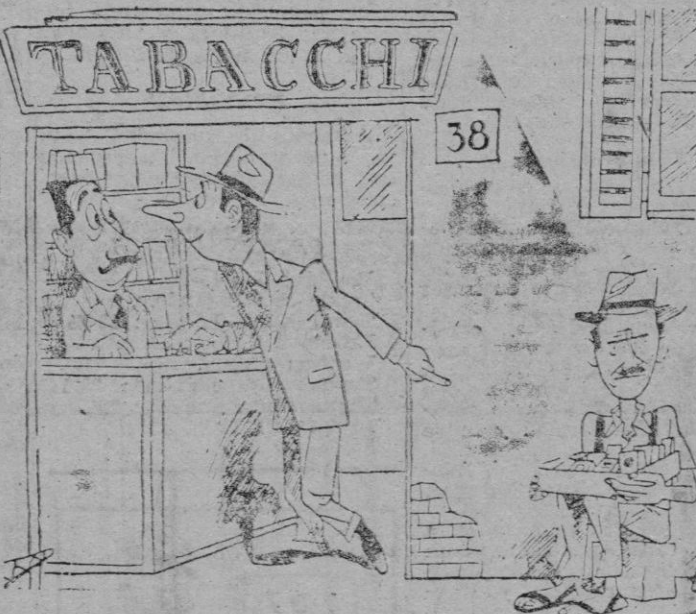
—Buenos días; desearía un paquete de aquellos cigarrillos. (De "Marc'Aurelio" - Roma)