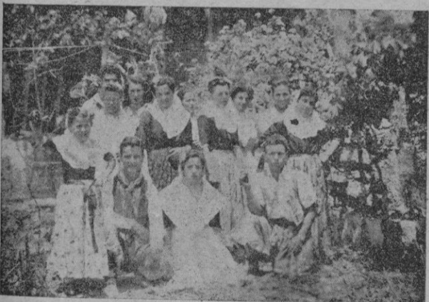
El grupo folklórico de San Juan

Como se ve, San Juan no sólo vive entregado a la explotación de la riqueza material de su suelo sino que también quiere vivir y reincorporar a todas sus fiestas, y en cualquier punto de la isla, por medio de es-