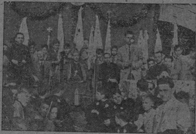
La presidencia del acto celebrado en la plaza del Ayuntamiento, con el Prelado, el Consiliario de los Jóvenes, el Alcalde de Santa María, el Consiliario de los Aspirantes y el encargado de la Parroquia.