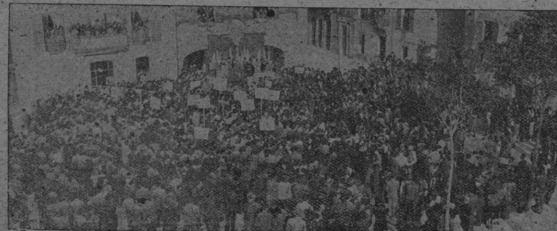
Manifiesto a pie de calle que ofrece la citada plaza que llenaban a reboar los 1.500 aspirantes de A. G. reunidos en Santa María.