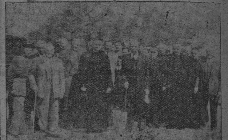
Las primeras Autoridades de Campos saludan al nuevo Ecnómo en los confines del término municipal con Porreras