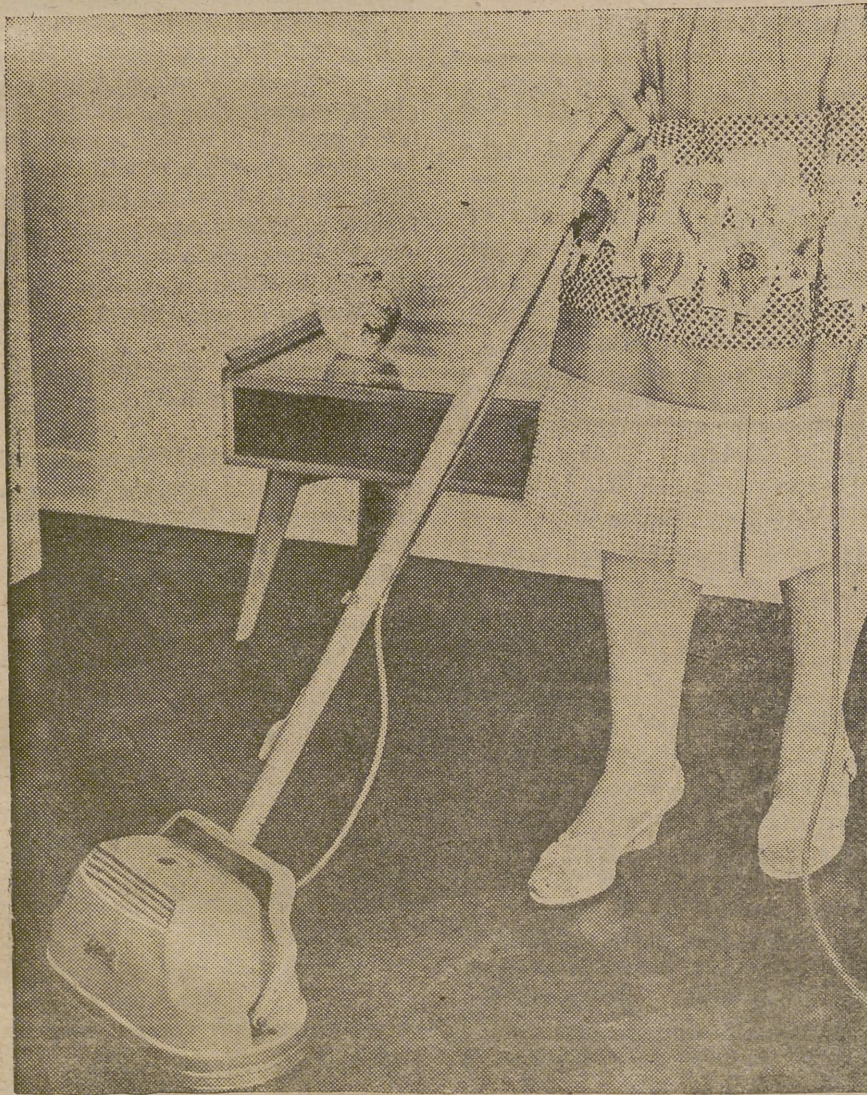
Esta pulidora de pisos tiene una envoltura para el motor y la transmisión, hecha en una sola pieza de plástico polietilénico Rigidex, de alta densidad. Se eligió el material Rigidex por su alta resistencia al impacto, que hace casi irrompible la envoltura, y por su no menor resistencia a las sustancias químicas, los aceites y las grasas. Damos esta nota para las amas de casa a quienes pueda favorecer la noticia