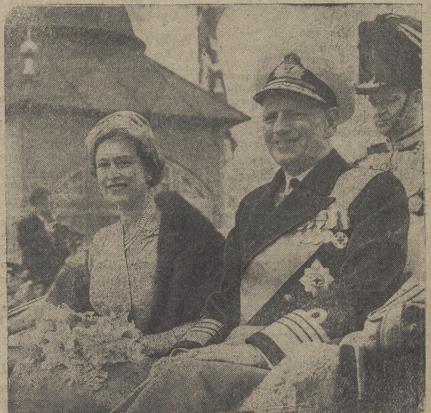
En esta fotografía se ve a la Reina Isabel II sentada al lado del Rey Federico de Dinamarca durante el desfile del cortejo real por las calles de Copenhague, desde el puerto hasta el palacio de Amalienborg.