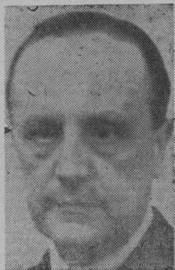
El Excmo. Sr. Ministro de Justicia

tos urbanos, recientemente publicado, y dijo que, pese a todas las disposiciones dictadas sobre la materia, encaminadas a conseguir la mayor equidad en