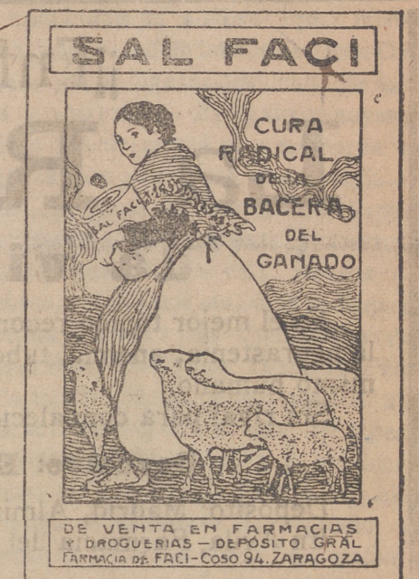
AVILA.—Tipografía de Senén Martín.

aprendizas adelantadas y oficiales de sastré. Calle de Valladolid núm. 28, bajo.