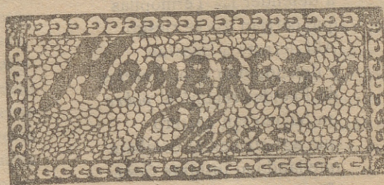
FERNANDO I EL MAGNO

El líquido que producen tienen el mismo gusto y aspecto que el obtenido con las que maduran en la planta; pero si hubiera sospecha de que pudiera alterar el sabor del aceite, de primera calidad, se hace pensando aparte y por lo menos se conseguirá un producto propio para todos los productos industriales á que se destinan las grasas vegetales, aun cuando no se destine al consumo como alimento.