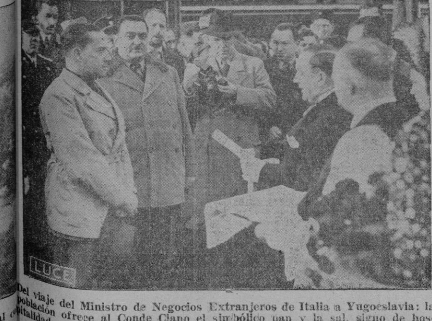
El viaje del Ministro de Negocios Extranjeros de Italia a Yugoslavia: la población ofrece al Conde Ciano el simbólico pan y la sal, signo de hospitalidad, a su llegada a la estación de Bolje.