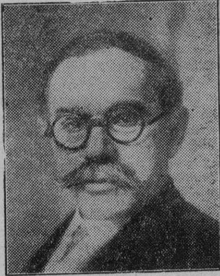
Berlin. — Friedrich Wilhelm Goebel, inventor de los tanques que ha fallecido en medio de la mayor miseria.

Se aprobó un nuevo impuesto sobre gramolas y altavoces en los cafés y ba-