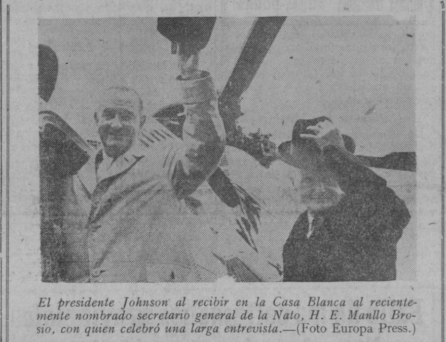
El presidente Johnson al recibir en la Casa Blanca al recientemente nombrado secretario general de la Nato, H. E. Manlio Brosio, con quien celebró una larga entrevista.

En otras votaciones parciales sobre el capítulo segundo se han reunido mayorías que oscilan entre 2.076 y 2.099 votos contra una minoría de 46 a 92 votos. En un solo caso la mayoría se redujo a 1.872 votos contra 292 de la minoría.—Efe.