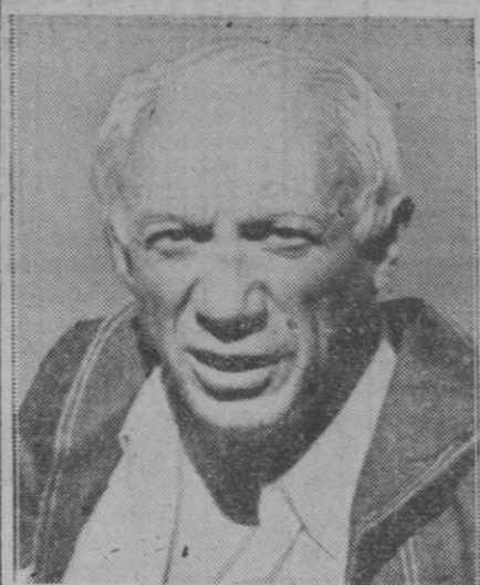
Pablo Picasso, célebre pintor español, que ha cumplido el pasado día 25 de Octubre 75 años

Frió intenso en Linares Linares, 2.—El frío es intenso en esta zona. Esta madrugada, la temperatura fué de dos grados bajo cero. Cifra.