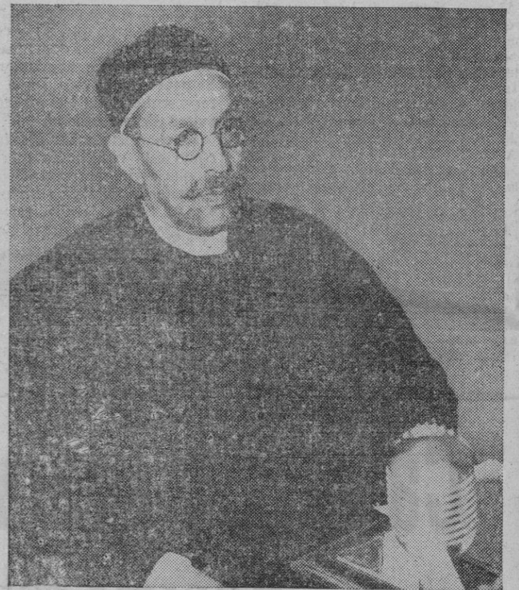
Mohammed Idris Al Mahdi Al Senussi, primer Rey de Libia, proclamando ante el micrófono, el día 24 de Diciembre de 1951, la independencia de aquella nueva nación