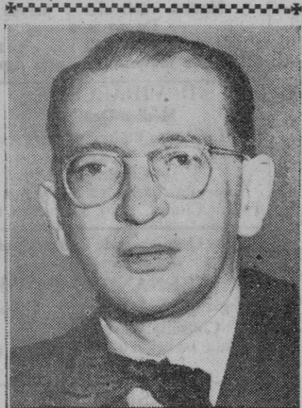
Edgar Faure, nuevo presidente del Consejo de ministros de Francia

Londres, 29 (1 t.).—Rusia acusa a los Estados Unidos de hacer preparativos en el Oriente Medio para la tercera guerra mundial, en una nota entregada al encargado de Negocios de Norteamérica en Moscú.