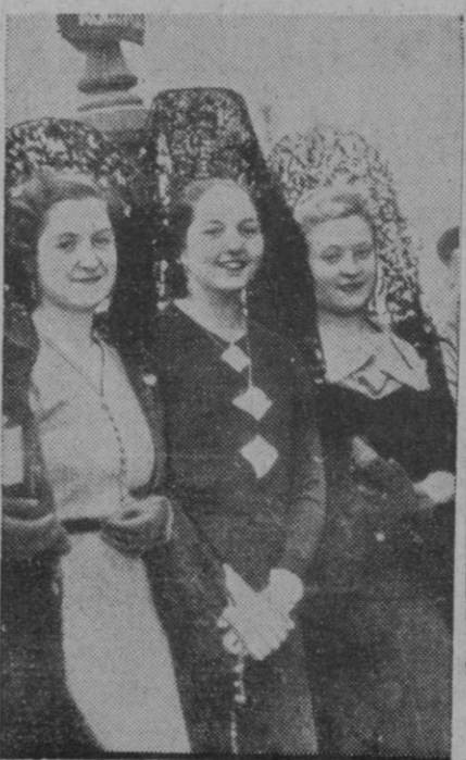
Gentiles madrileñas, después de la visita a los Sagrarios, ponen en las calles una nota de color y beila tradición.