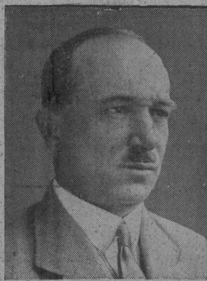
El doctor Benes, que está abriendo paso en su país, no subyugó si de grado o por fuerza, al bolchevismo

La radio de Praga ha informado en (Continúa en la página 3)