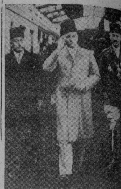
El rey Faruk de Egipto, que sufrió recientemente un accidente de automóvil, en el que resultó con heridas leves, se encuentra ya restablecido. En la foto aparece durante una parada militar en El Cairo