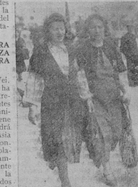
En Francia los judíos están obligados a ostentar sobre su indumentaria la «estrella de Sión». En la foto vemos a dos mujeres hebreas que llevan, bien visible, el mencionado distintivo.

El gas había penetrado en la habitación por un tubo que se está instalando en la casa, de recentísima construcción.—Logos.