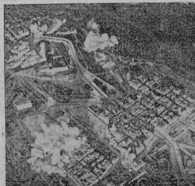
Vista aérea del puerto de Malta (La Valetta), durante uno de los continuos bombardeos de los aviones del Eje

Frente a lo exótico y lo antinacional, lo nuestro, lo típico, lo que está enraizado en nuestro corazón y en nuestras costumbres. Este es el sentido del Concurso nacional de la Sección Femenina. Y dentro de él, las muchachas de la Falange Segoviana han prestado un gran servicio a la causa regional, y en su decidido propósito han encontrado precisamente la más alta recompensa: el éxito por el que nosotros, y todos los segovianos, hemos de felicitarlas con el más amplio entusiasmo.