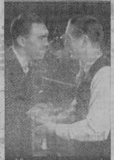
Un grupo de boxeadores franceses se encuentra actualmente visitando Alemania, invitados por Max Schmelling. En la fotografía vemos al gran boxeador alemán y al también ex campeón mundial, George Carpentier (francés), saludándose cordialmente.

Tokio, 7 (5 t.)—Wang Ching Wei, jefe del Gobierno nacional chino, ha declarado en Nankin, en una entrevista concedida a los representantes de la Prensa con ocasión del V aniversario del conflicto chino, que tiene la convicción de que el Japón saldrá victorioso de la guerra en el Asia oriental. «La terminación de este conflicto—prosiguió—decidirá, no solamente la suerte del Japón, sino también la de China. Aparentemente Chang Kai Chek ha creído que la potencia económica de sus aliados bastaría para darle la victoria si la guerra se prolongaba. La realidad de la ayuda anglo-norteamericana pertenece definitivamente al pasado, de tal forma que el mariscal chino lamentará muy pronto, amargamente la con-