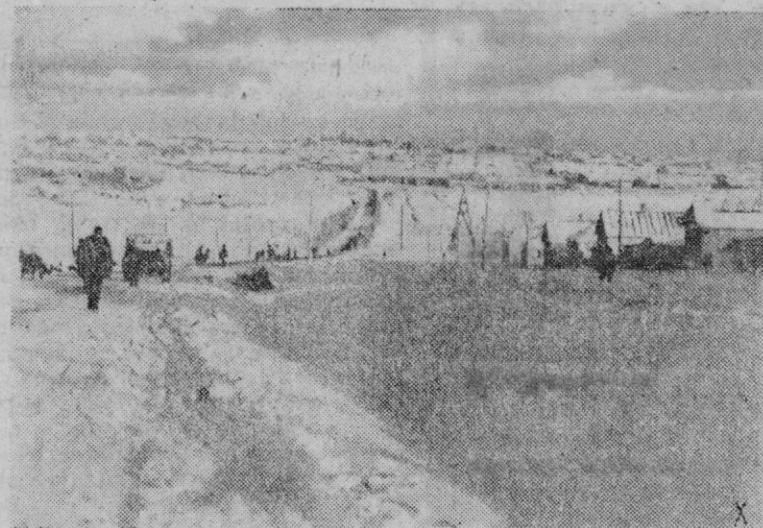
Los coches alemanes que llegan por esta carretera de la región del Donetz, hacen un alto en un refugio de la misma para reponer las fuerzas.

—«Cómo no querer a España si llevamos la misma sangre, los mismos apellidos y hablamos el mismo idioma! Lo que más admiramos en ella es el valor y el espíritu de sacrificio de que son capaces los españoles cuando les empuja un alto ideal. Estoy seguro de que España, país tan rico, una vez que la tragedia de Europa amortigué, renacerá con mayor empuje que nunca. Yo soy profundamente optimista en cuanto al futuro de España.»