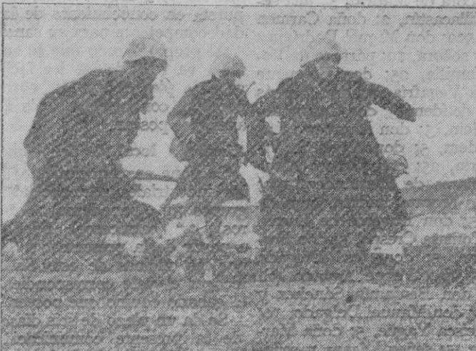
Después de una conveniente preparación artillera, a la orden de mando los infantes alemanes se lanzan al asalto de una posición roja.