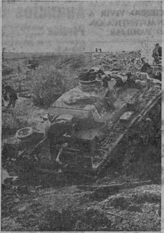
Grandes dificultades naturales del terreno, agravadas ahora por las lluvias y nieves, se oponen al avance de los tanques alemanes en Rusia, pero este obstáculo, colaborador de los planes soviéticos, tampoco es suficiente para detener su victoriosa marcha.

(6 t.)—Desde Helsinki informan que el Gobierno finlandés por la representación diplomática norteamericana un plazo de decisión que expira el 15. En dicho ultimátum se exige que cesen las hostilidades contra la U. R. S. S., y se determinen modalidades para que termine. En caso de negativa, el Gobierno británico proclamará el estado de guerra entre Finlandia. El Gobierno se ha negado ayer a aceptar el ultimátum británico.—Efe.