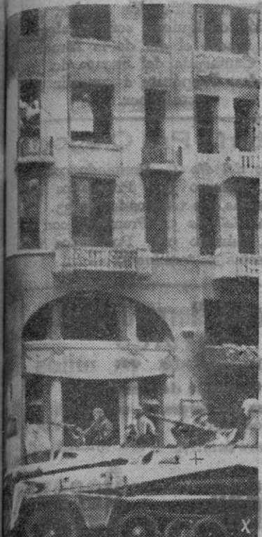
Un grupo de soldados soviéticos se hicieron fuertes en una casa de Charlow; rápidamente los tanques alemanes acuden para abatir la resistencia.

Singapur son llamados urgentemente los marinos aviadores que se hallaban disfrutando permiso