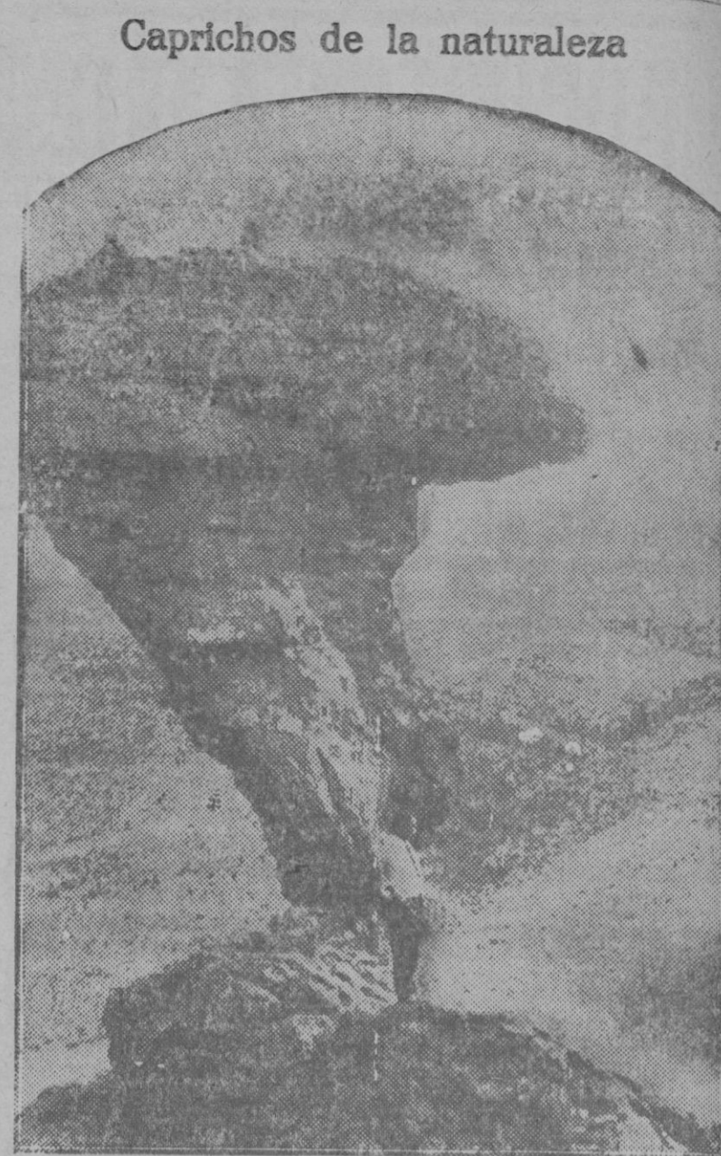
Una roca que se balancea en Idaho (Estados Unidos)

Deuda Interior . . . . . 73'35 » Exterior . . . . . 85'75 Amortizable 4 p. . . . . 00'00 » 5 p. . . . . 91'60 Emisión 1920 . . . . . 87'50 Deuda Amortizable 5 p. . . . . 101'20 Emisión 1927 Libre . . . . . 86'10 Emisión 1927. Con impuesto . . . . . 94'50 Cedulas Banco Hipotecario España 4 p. . . . . 97'70