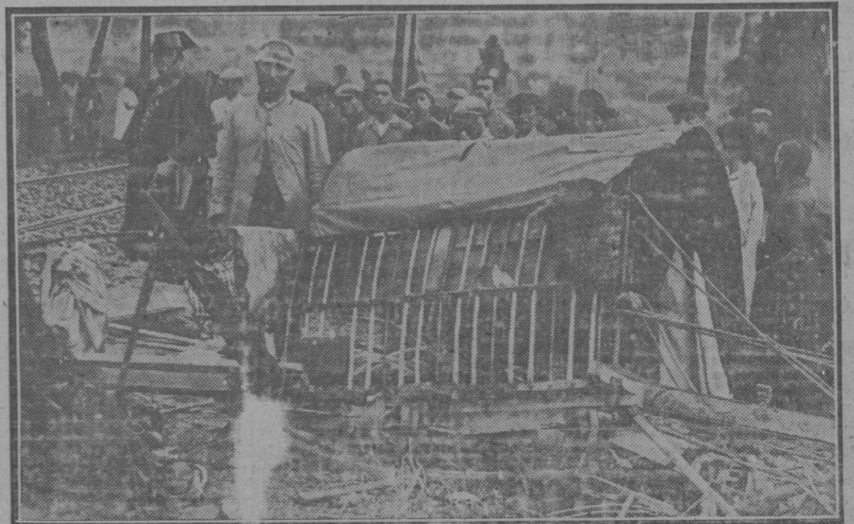
Accidente Ferroviario en Córdoba: Uno de los carros arrollados por el fatídico tren 96 en el paso a nivel de Pedroches. En el hecho resultó muerto un cosario y gravemente herido el carriero