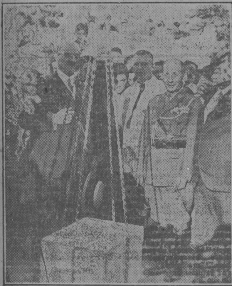
Torredembarra (Barcelona): Colocación de la primera piedra para las obras de abastecimiento de aguas de la localidad