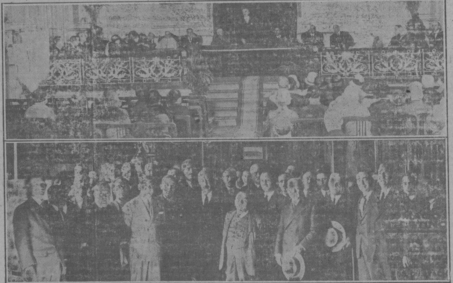
1. San Sebastián: Homenaje tributado a los maestros, cuyo solemne acto se celebró en el Instituto. 2. Vitoria: Grupo de maestros de Alava reunidos en el Ayuntamiento, donde fueron objeto de un homenaje