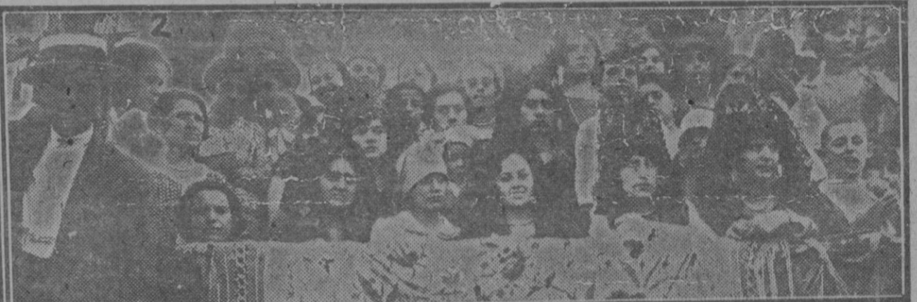
Nador (Melilla). 1. Distinguidas señoritas que presidieron la becerrada que se ha celebrado con motivo de las fiestas del poblado.—2. Otro de los palcos ocupado por bellísimas señoritas