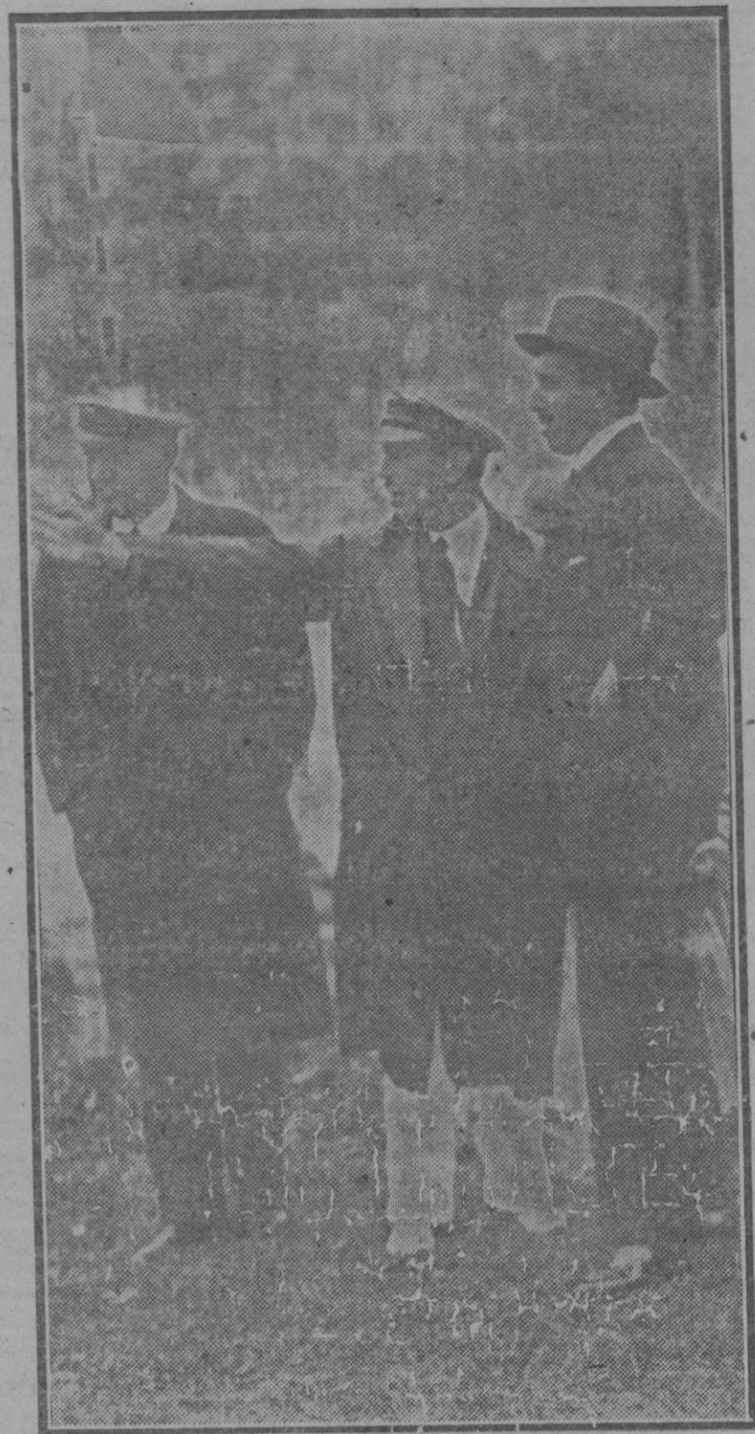
Su Majestad el Rey contempla los terrenos del pintoresco pueblecillo de Pedreña que habrán de ser dedicados en breve a campo de «golf»