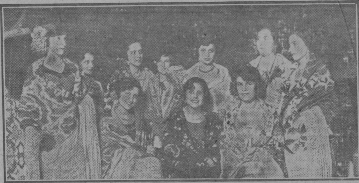
Benimaimet (Valencia): Señoritas de la colonia valenciana que obtuvieron premios en el concurso celebrado con motivo de las fiestas.