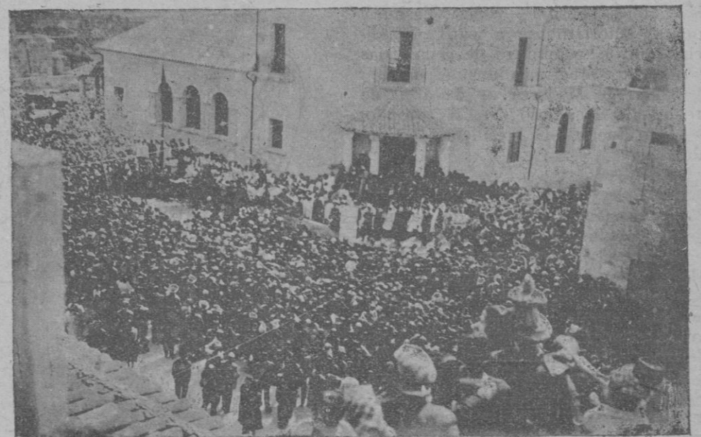
14 Abril.—Inauguración de la Escuela Graduada de niños de Manacor

personas, lo que prueba el ambiente favorable la simpatía con que se había acogido en la isla el anuncio de la campaña católica, por una enorme masa ciudadana que ha visto defraudados sus propósitos con la suspensión de los actos anunciados.