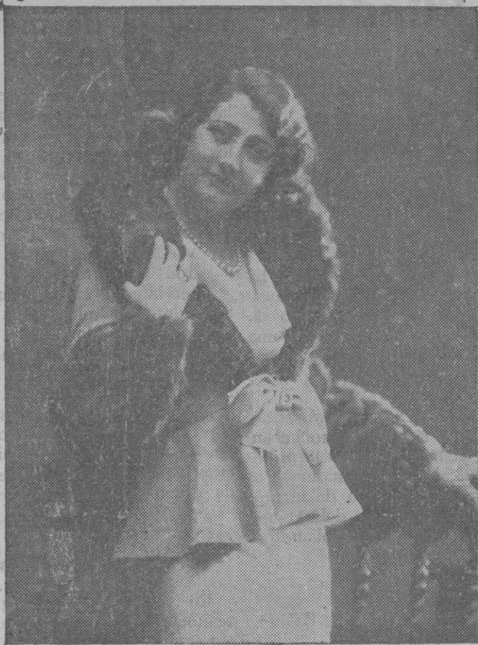
La genial y bella primera actriz Isabel Barrón, que esta noche debuta al frente de su compañía de comedias