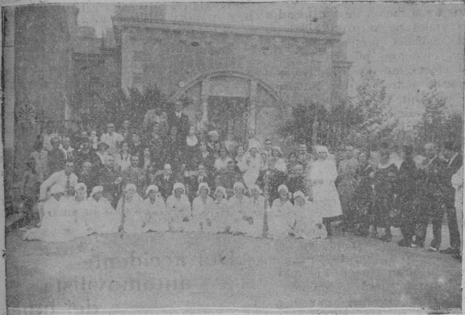
Los invitados al acto, con las enfermeras de la Clínica de Santa Catalina Thomás