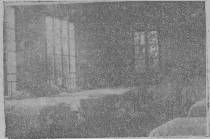
Uno de los espléndidos dormitorios de la Colonia