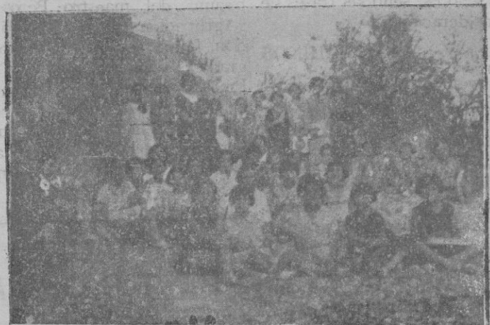
Un alto, en uno de los cotidianos paseos

talle, cómo se ha desarrollado la vida a bordo del «Miguel de Cervantes» en los últimos días.