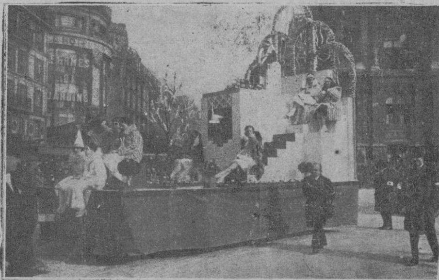
La carroza de la reina de las reinas

más beneficiosa y más armónica y adaptable a la naturaleza humaná.