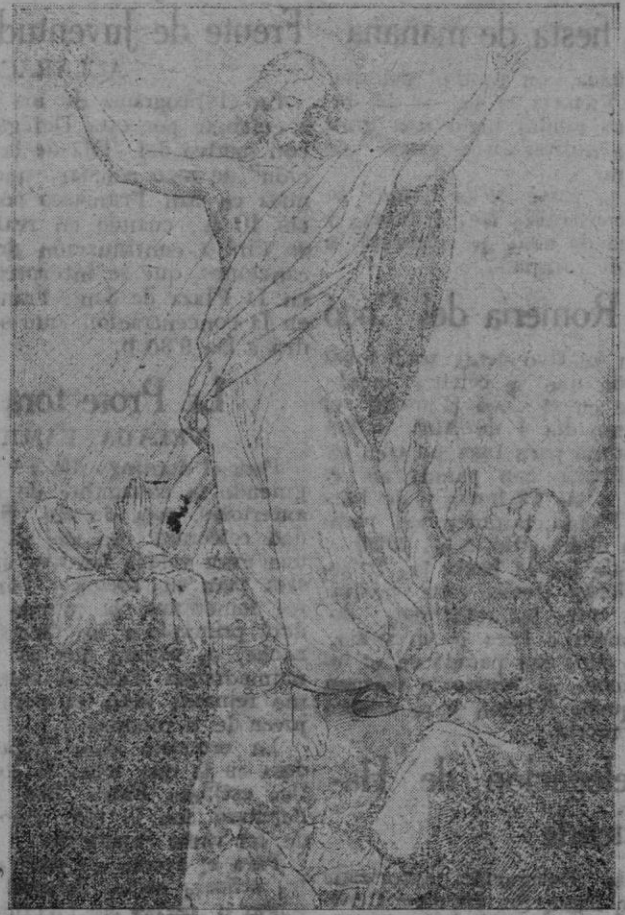
Los cielos y la tierra se estremecieron de alegría. Jesús había resucitado. «Destruid este templo — dijo el Divino Maestro — y lo reedificaré en tres días». Y el símbolo de los Apóstoles ha seguido llevando a todos los tiempos una enseñanza gloriosa y magnífica: «resucitó al tercer día».

CON POCO DINERO restaurará sus muebles en su domicilio. Barniz muñeca y encerado. Quedan como nuevos. Presupuesto gratis. Plaza de Cort, 12. Teléfono 2698.