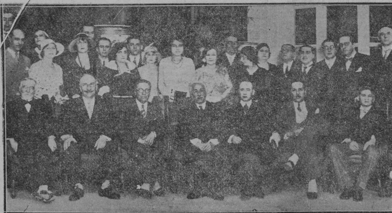
En el Hotel Ritz.—El Presidente del Gobierno Provisional, Sr. Alcalá Zamora, y el ministro de Estado, Sr. Lerroux, con los Embajadores Americanos, reunidos en el Banquete de despedida al ministro de Méjico

Lo contrario sería exponer el erario público a un descalabro, o a provocar un encarecimiento de un elemento tan preciso bajo todo aspecto, como es el agua.