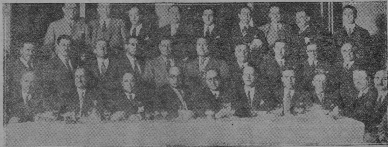
Banquete celebrado con motivo del XV aniversario de la fundación del Colegio de Corredores de Fincas

Conviene tener en cuenta que aparte de la sección ordinaria del período revolucionario, numerosos cuadros y recuerdos proceden de colec-