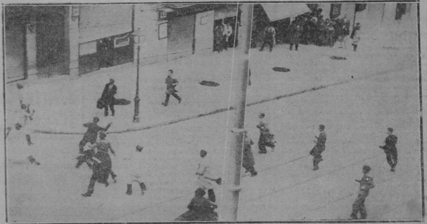
MADRID.— Los sucesos estudiantiles. Los estudiantes de medicina apedreando a los guardias, frente a la Facultad en la calle de Atocha.