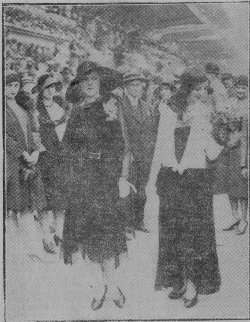
Este año ha tenido la particularidad de asistir una gran cantidad de damas elegantes entre las cuales figuraba «mis Paris» luciendo los últimos modelos de la moda. El premio de los Drags constituye una de las sesiones más animadas de las Carreras de Caballos de París

Un periódico, comentando esta situación, dice que como las personas que viven con lujo gastan muchas veces más de lo que pueden, para restablecer el equilibrio entre los gastos y los ingresos se muestran morosas para pagar todas aquellas cuentas cuya no liquidación no entraña ningún escándalo inmediato.